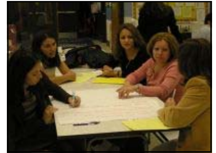
Planes para la Acción : Círculo de Estudio en Español para el Núcleo de Blair