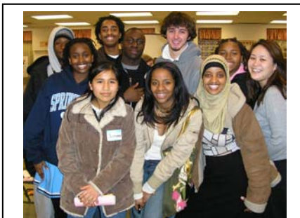
Participantes y Facilitadores de Paint Branch Y Springbrook High School